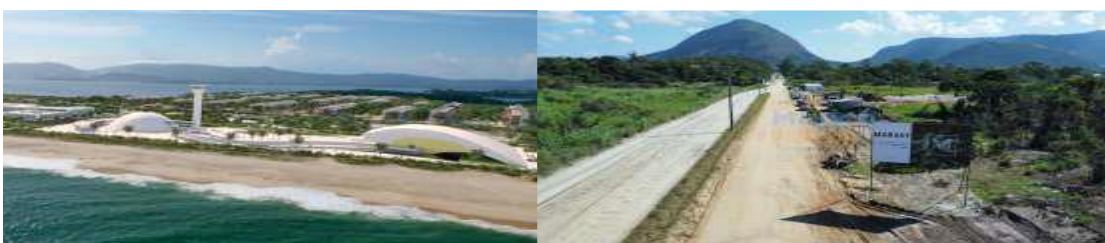
Imagens e videos panoramicas de Resort Maraey disponibilizado no Google.