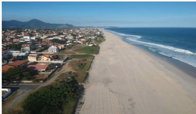
do que restou da vegetação de resinga 09/05/22.

empreendimento em 2013, durante o curso do licenciamento do projeto. A empresa trabalha ao lado das lideranças indígenas da Mata Verde Bonita e de representantes da Prefeitura de Maricá e da FUNAI na busca por uma área definitiva para o assentamento permanente da aldeia, mais adequada às necessidades do grupo, com solo fértil e acesso facilitado à água, como pleiteia a comissão de representantes dos indígenas.”