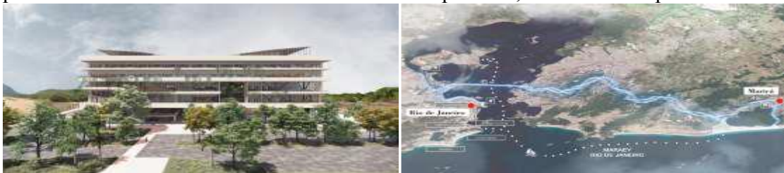
Fotos de mapas e imagens ficcionais do futuro empreendimento Maraey. Paraiso na Terra.